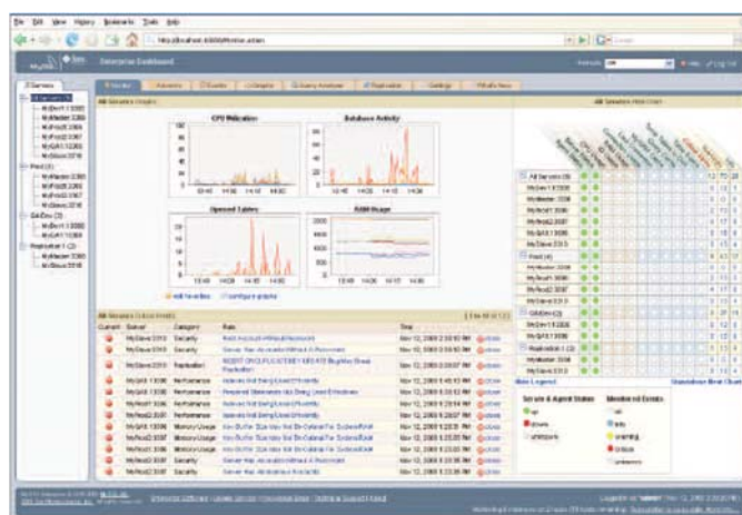
Figure 1. MySQL Enterprise Monitor offre une vue d'ensemble de la santé de vos bases de données MySQL.

MySQL Enterprise Monitor et MySQL Query Analyzer offrent d'un coup d'œil une vue d'ensemble de la santé de vos bases de données MySQL. Il surveille en permanence vos serveurs MySQL et vous informe des problèmes potentiels avant tout impact sur votre système. C'est comme si vous aviez à vos côtés un « assistant DBA virtuel » qui vous recommande les meilleures pratiques à suivre pour éliminer les risques de sécurité, améliorer la réplication et optimiser les performances. Les DBA et les administrateurs système ont ainsi la possibilité de gérer plus de serveurs, en moins de temps.